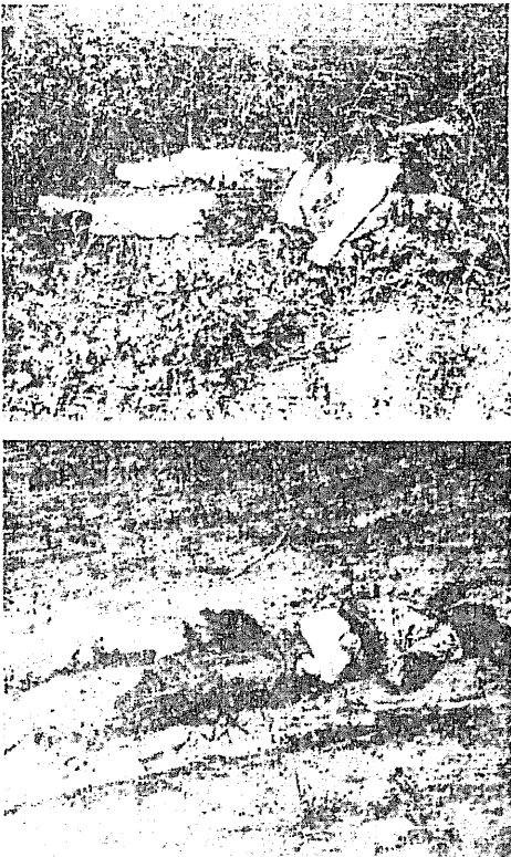
Снимки из п. Горского Кировского р-на Ферганской обл.

Ответ на это дал член Политбюро ЦК КПСС, Председатель Совета Министров СССР Н. И. Рыжков в своем выступлении на собрании республикан