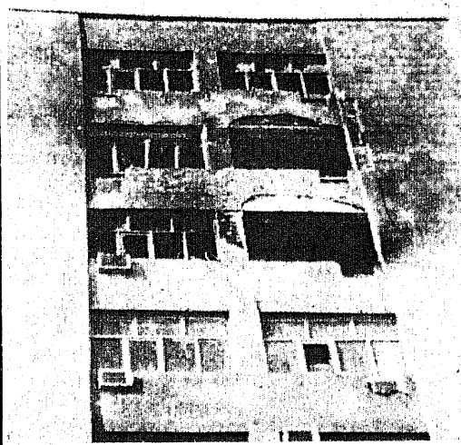
Здание ВЧ АПК АзССР обстреляли из малокалиберного...

С глубокой верой в это я обращаю свои молитвы к Всемогущему Создателю, прося