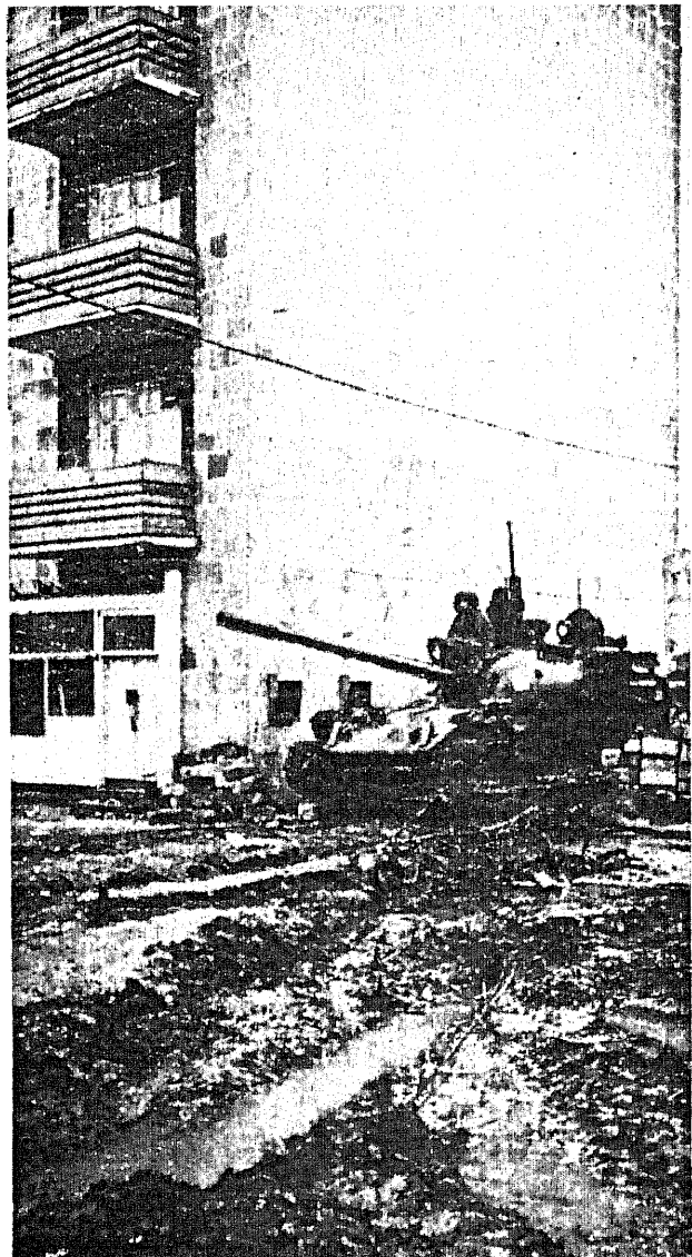
Днем и ночью орудия танков нацелены на жилые дома.

Обсуждались возможности политического урегулирования Закавказского кризиса. В конце встречи было подписано совместное коммюнике, где подчеркивается, что дальнейшая эскалация конфликта не отвечает интересам никакой из сторон, противоречия необходимо устранить мирными средствами. Инициатива Балтийского совета является по сути дела первым конструктивным шагом на пути разрешения азербайджанско-армянского конфликта.