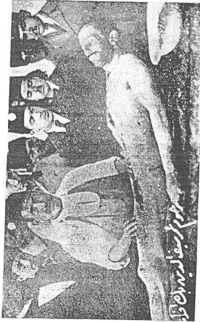
Hastalığı ve ölümlü nedeni araştırılmıyan Ö. Seyfettin Haydarpaşa Tıp Fakültesi Hastahanesinin otopsi masasında. Bu fotoyu kitaplık memuru çekmiş. Cesedin üstüne elini koyan otopsiçileri yapan Sivasslı bir hafeme. Çevresinde öğrenciler. Üstü ilköğretme ve sâbit çıkma kimseler yok ortalıkta...

30 ocak 1919 da İttihâteçilerin o kadar özlenen ve geciken tevkiflerine başlanıyor. İleri gelenlerin 2 / 3 kasım 1918 deki kaçmalarından bir yıl sonra, muhâlif gazetelerin açtıkları azgın bir suçlama kampanyasının hazırladığı uygun bir hava içinde, Tevfik Paşa hükûmetinin İttihâteçileri tevkife karar verebildiğini görüyoruz. İlk gününde, aralarında İsmail Canbolat, Hüseyin Cahit, Kara Kemal ve