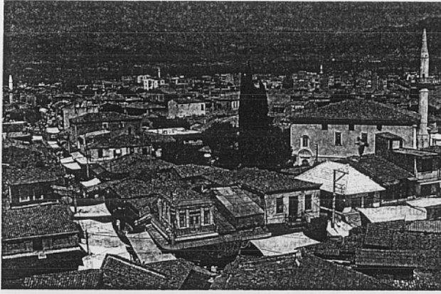
Ödemiş Çarşısı (1998): Katsırcılar sokağı Ödemiş'i Tire'ye bağlayan, hâlâ bozulmamış eski yoldur.