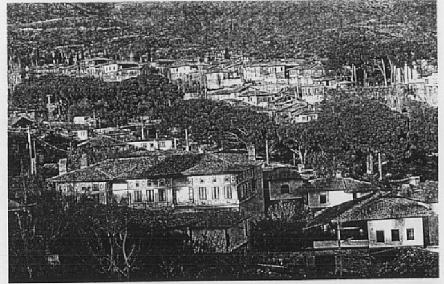
Birgi (1998): Çakırcalı'nın yaşadığı dönemin izlerini hâlâ taşıyor.

- Osman, bu cavur Çakırcaya kurşun batmıyor, (elinde tuttuğu kurşunu göstererek) şu telli kurşunu Birgi'de keskin hocalara tılsımlattım, bu-