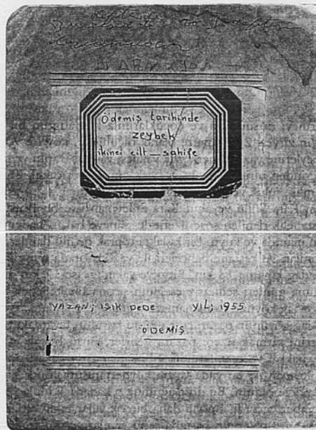
Halil Dural'ın ikinci defterinin kapağı.