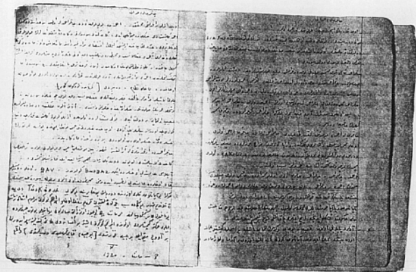
Halil Dural'ın defterinden bir sayfa.