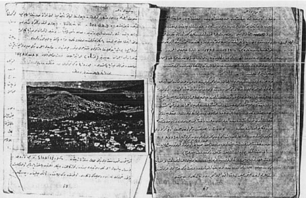
Halil Dural'ın defterinden bir sayfa.